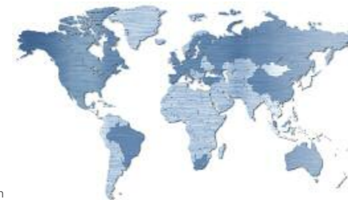
Vertriebsnetz SCHMOLZ + BICKENBACH

Ob länderspezifische Standardgüten oder kundenspezifische Sonderwerkstoffe für anspruchsvolle Bauteile: Mit SCHMOLZ + BICKENBACH haben Sie einen Servicepartner für jede Stahllösung – wenn Sie es wünschen, bis hin zum einbaufertigen Werkteil.